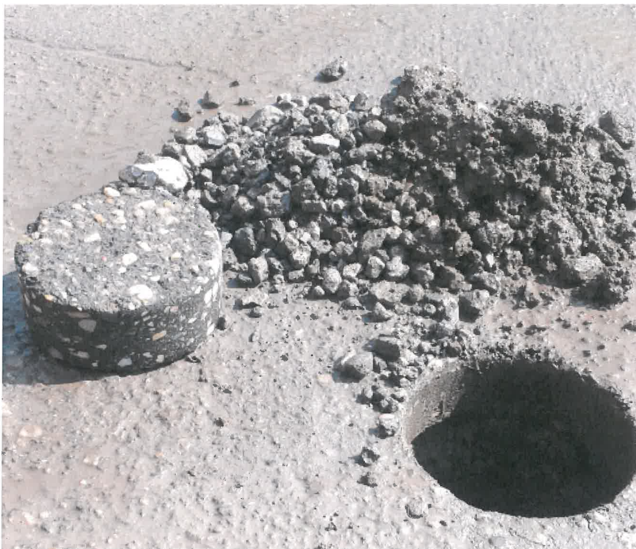
1. kép: Fúrást követően Nyíregyháza, Meggyes utca 11. szám előtt tengelyben nyomvonal helyreállítás felett

Rétegfelépítés: 65 mm aszfaltbeton kopóréteg (16 mm szemnagyság) kb. 250 - 260 mm zúzottkő és kohósalak keverék alapréteg Tükörszint (iszapos helyi talaj)