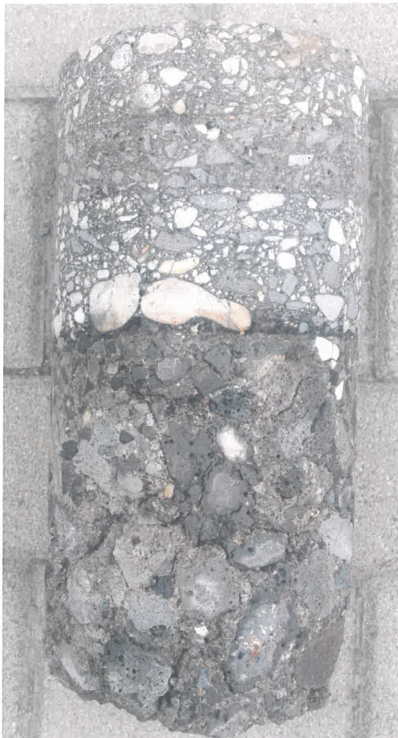
4. kép: Fúrt minta Nyíregyháza, Meggyes utca 21. szám előtt tengelytől 1,0 m-re